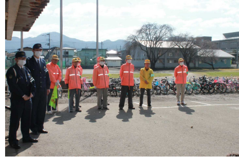
交通教室には、交通安全協会有浦支部の皆さんがお手伝いに来てくださいました。ありがとうございました。