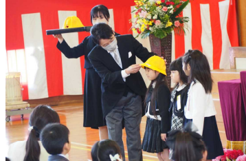
気を付けて来てね