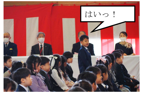
大きな返事ができました